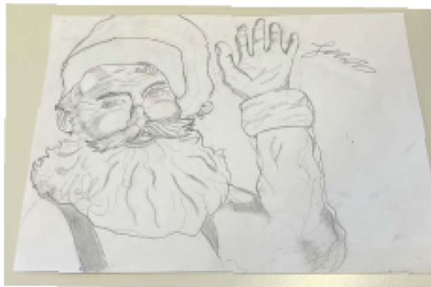
I andledningen af at det snarter jul har Jakob fra 2y komponeret en lille jultegning